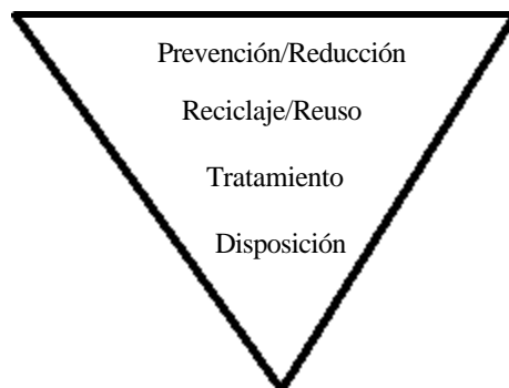
FIGURA 4.1: Estrategia de triángulo invertido para prevención de la contaminación 9 .

La idea básica es prevenir la generación de contaminantes en lugar de controlar la contaminación o manejar los residuos una vez que ya se han generado. El término reducción en la fuente es, prácticamente, un sinónimo de prevención de la contaminación. Una estrategia de prevención supone una cierta jerarquización de las acciones de control de la contaminación. En la figura 4.1 se presenta la llamada estrategia del triángulo invertido que ilustra respecto a esta jerarquización y como se reducen las opciones al avanzar en el ciclo del producto.