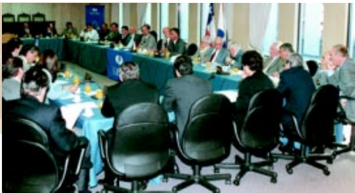
En diciembre del 2002, Sofofa se reunió con una delegación de asesores del Senado de EE.UU., con motivo de negociación del TLC.

A partir de la vigencia del Tratado, el 87% de las exportaciones chilenas a Estados Unidos ingresará a ese mercado libre de aranceles. Al cuarto año, el 94,8% de los envíos chilenos estará libre de gravámenes.