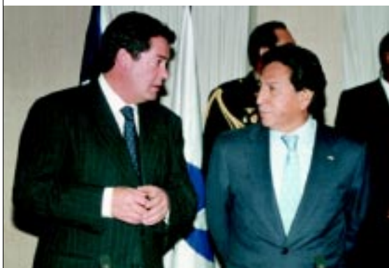
Sofofa recibió la visita del Presidente del Perú, Alejandro Toledo en agosto del 2002