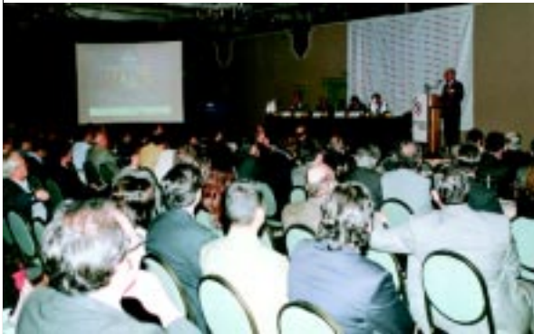
Sofofa y Amcham organizaron el ciclo de Seminarios "Oportunidades del Tratado de Libre Comercio Chile-EE.UU.: Cómo hacer más y mejores Negocios con EE.UU." En la imagen, sesión inaugural en el Hotel Hyatt de Santiago.