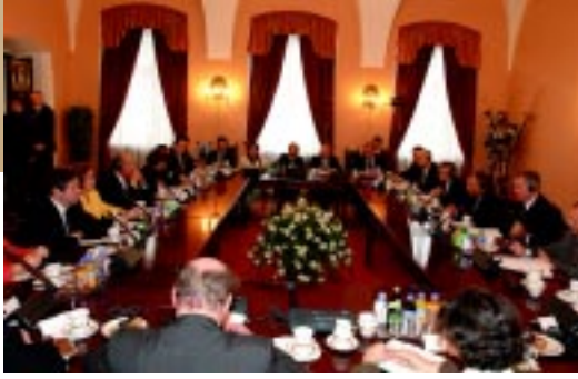
El presidente de Sofofa lideró la Misión Empresarial que acompañó la gira del Presidente de la República a Rusia, Hungría y Polonia, entre el 1º y 8 de octubre del 2002.