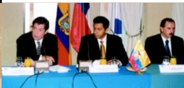
Encuentro con el Presidente electo de Ecuador, Lucio Gutiérrez (al centro) en diciembre de 2002.

Claro, lideró un encuentro con el Presidente Electo del Ecuador, Lucio Gutiérrez, quien visitó nuestra sede acompañado por una veintena de empresarios ecuatorianos.