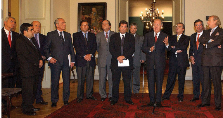
Reunión en La Moneda de los presidentes de ramas de la CPC con el Presidente Lagos para analizar marcha de Agenda Pro Crecimiento.