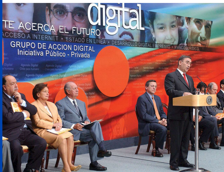
Lanzamiento de Agenda Digital 2004-2006.

Tribunales Tributarios Ley de Quiebras Mercado de Capitales II Ley Larga de Pesca Empresas de Trabajos Transitorios Bonos de Descontaminación Título Ejecutivo de la Factura Adaptabilidad Pactada de la Jornada Laboral Acuerdo de doble tributación con Reino Unido y Dinamarca Sistema de Certificación de Competencias Laborales