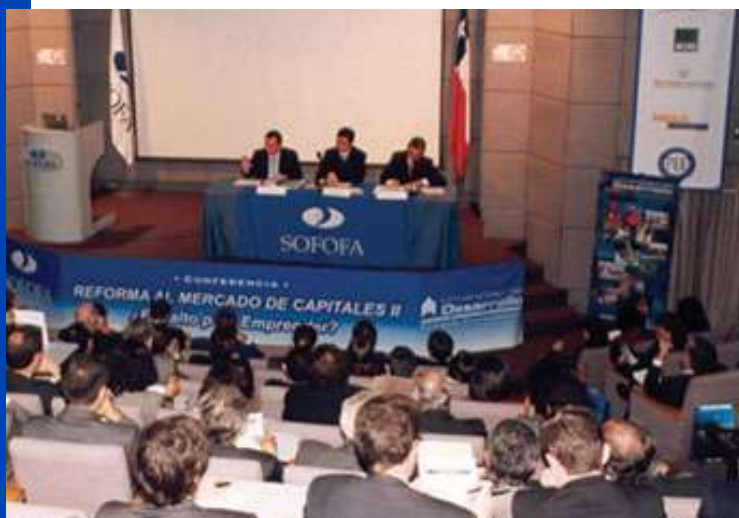
Conferencia “Reforma al Mercado de Capitales II, El Salto para Emprender”, en la que participaron cerca de 400 ejecutivos.