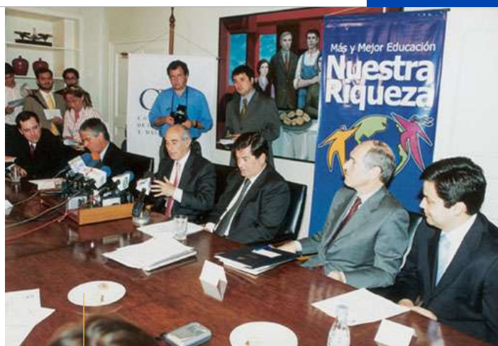
Los Ministros de Educación, Sergio Bitar, de Hacienda, Nicolás Eyzaguirre y el presidente de la CPC, y Sofofa, dieron a conocer el 24 de Noviembre del 2003 los ejes centrales del Capítulo Educacional de la Agenda Pro Crecimiento II.

La meta de la APC II es concordar un nuevo paquete de reformas de alto contenido estratégico, destinadas ahora a fomentar el desarrollo científico y tecnológico, a mejorar nuestra educación ligándola a las necesidades del crecimiento y de la empresa, a eficientar la prestación de servicios que realizan los organismos públicos, a fomentar las nuevas inversiones, a focalizar adecuadamente los esfuerzos que permiten estimular las exportaciones y la competitividad de los pequeños y medianos emprendedores y a incorporar a las regiones del país más rezagadas a los beneficios de la globalización y del crecimiento.