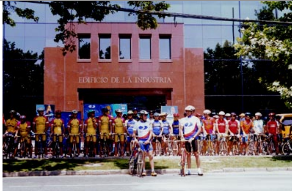
Largada del primer Giro Ciclístico Laboral Sofofa 2001 desde el Edificio de la Industria.

El 21 de Marzo de 2002 inició sus actividades la Comisión Gerentes de Recursos Humanos, dentro de cuyos objetivos está contar con una instancia de intercambio de conocimiento y experiencias en la Gestión de los Recursos Humanos, contribuir al análisis y discusión a cerca de temas laborales ante entornos cambiantes donde aumenta la globalización, como también compartir la opinión de la Comisión sobre aspectos que afecten a los trabajadores y por ende a las empresas al interior de la Sofofa.